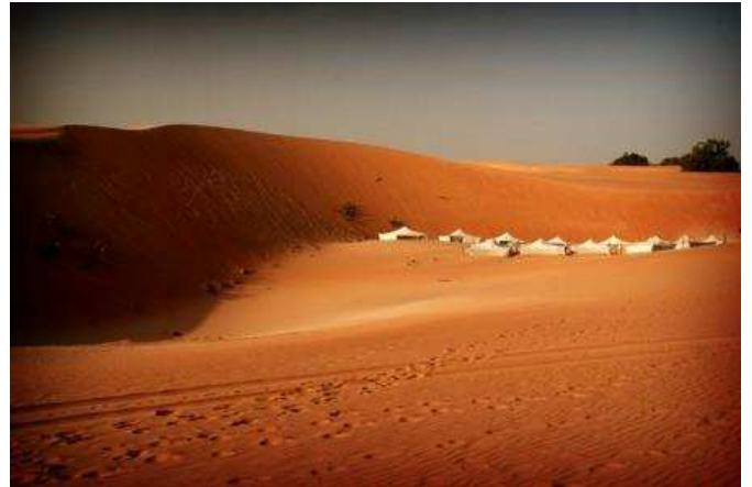
Desert de Lompoul