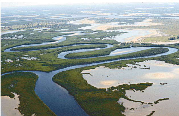
Saloum Delta National Park