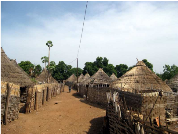
Assentament humà a Niokolo Koba