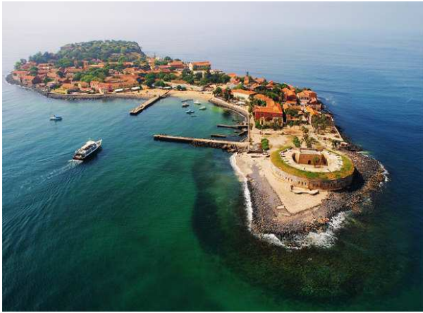
Illa de Gorée, Dakar