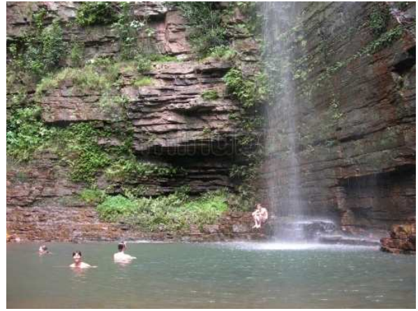
Cascada de Dindefelo, Niokolo Koba