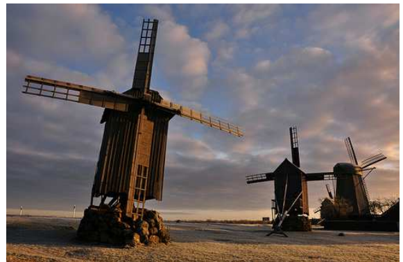
Illa de Saaremaa- Estònia