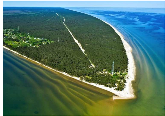
Cap Kolka - Letònia