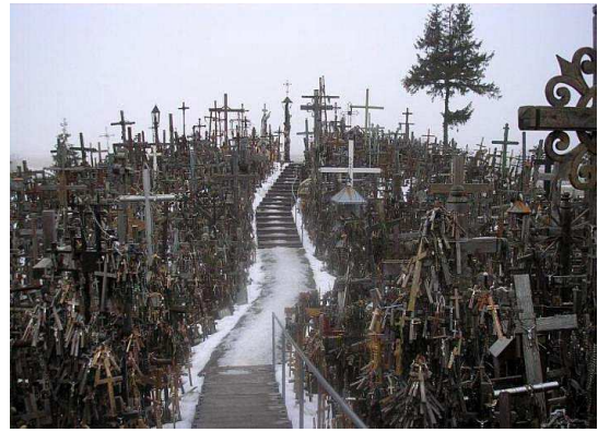
Turó de les creus - Lituània