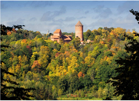
Bosc de Sigulda- Letònia