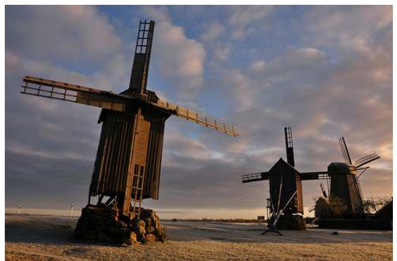
Illa de Saaremaa- Estònia