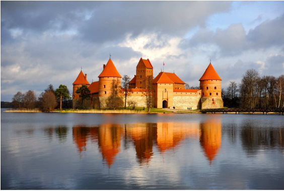
Castell de Trakai - Lituània