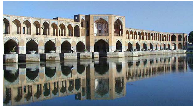
Ponts del riu, Isfahan