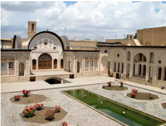
Casa de Tabatabaei, Kashan