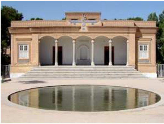
Temple del Foc, Yazd