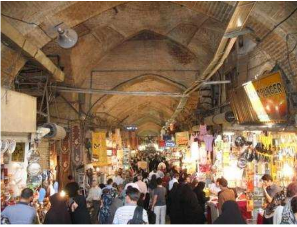
Basar a Tehran