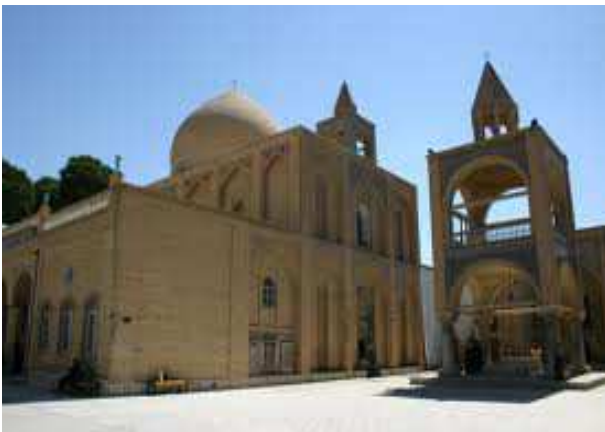
Església de Vank, Isfahan