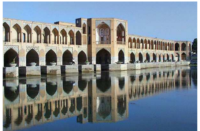
Ponts del riu, Isfahan