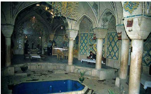
Banys de Ganjalikhan, Kerman