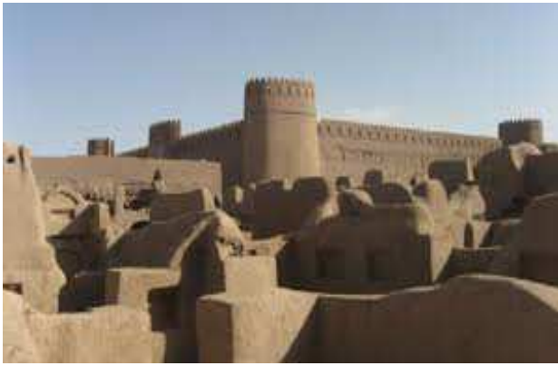
Ciudadella de Rayen, Kerman