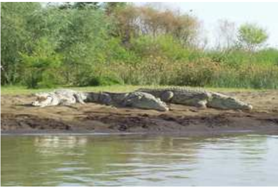
Cocodrils a Arba Minch