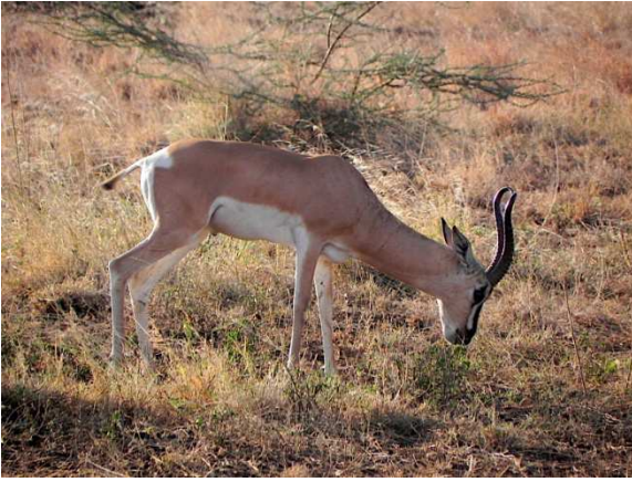
Parc Natural d'Awash