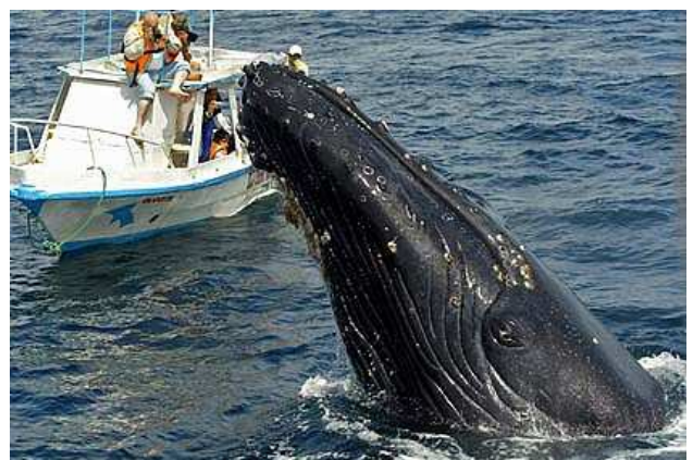
Balenes (Puerto López)