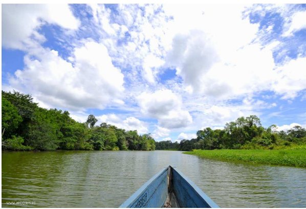
Rio Napo (Amazones)