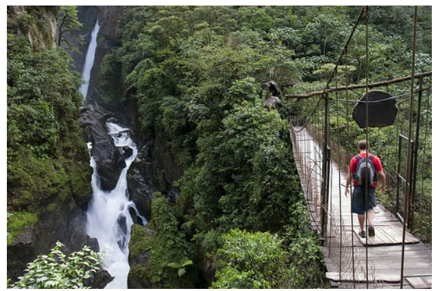
Cascada Pailon del Diablo (Puyo-Baños)