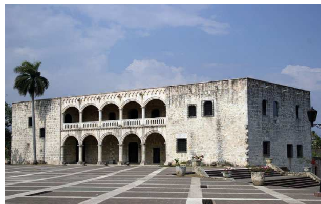
Casa de Colón, Santo Domingo