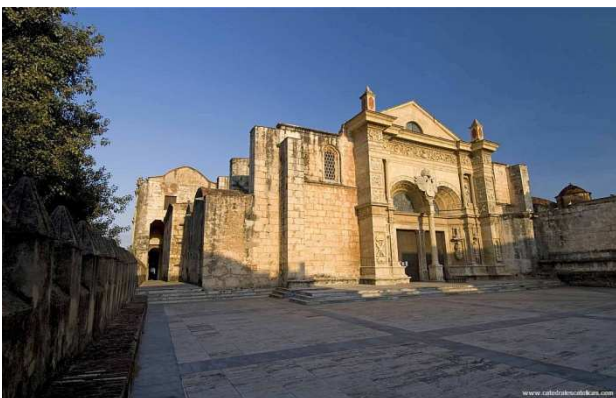
Catedral de Santo Domingo