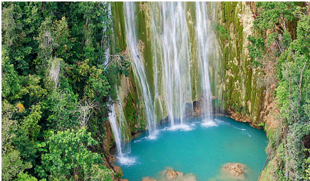
Cascada Limón, Samaná