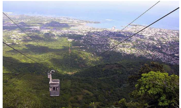
Teleférico a Puerto plata