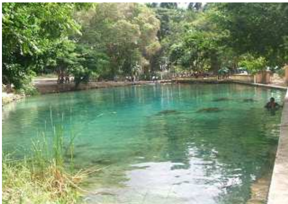
Piscina natural d'aigües termals