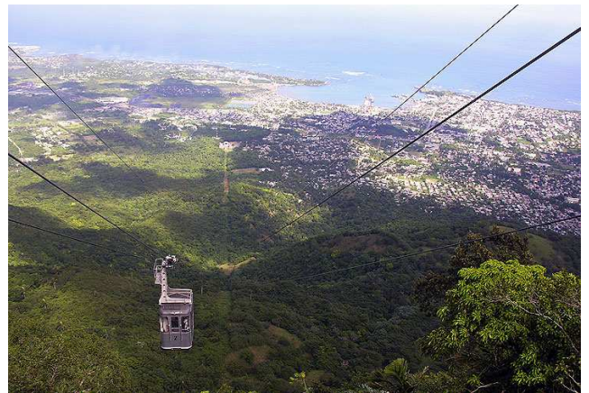
Telefèric a Puerto Plata