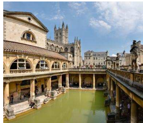
Banyans romans a Bath