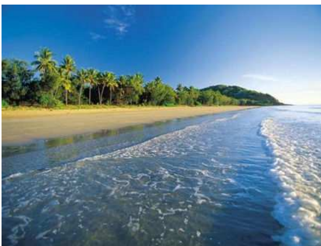
Platja a Queensland