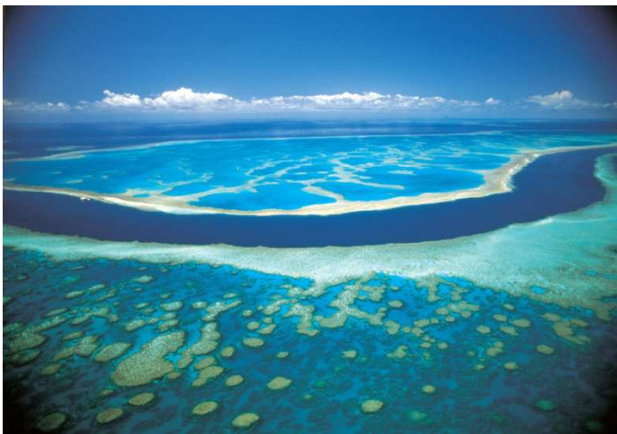
Gran barrera de Corall