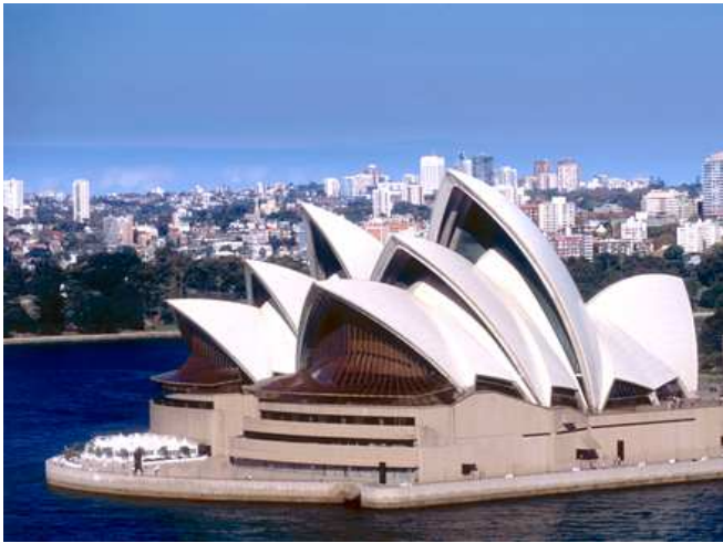
Opera de Sydney