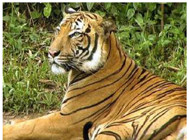
Tigre a la reserva de Periyar