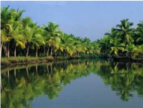
Backwaters a kerala