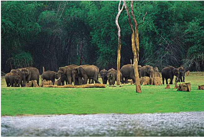
Elefants a Kerala