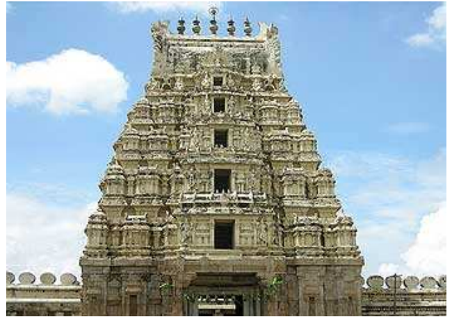
Tmple de Ranganathaswami