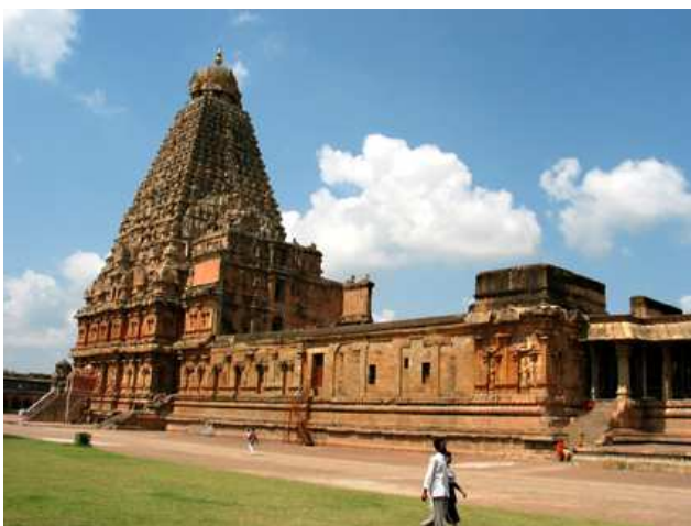
Temple de Bridavishava