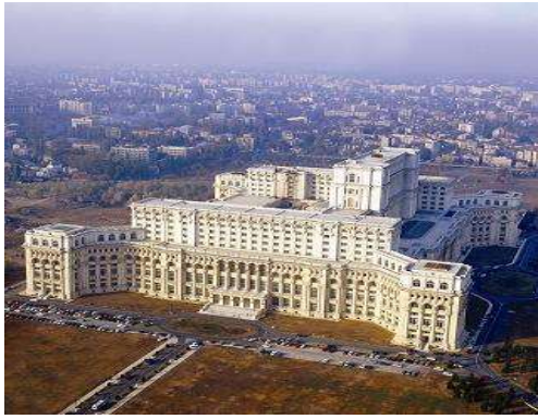
Palau de Ceausescu- Bucarest