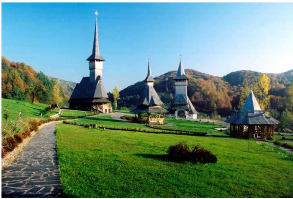
Església de fusta de Maramures