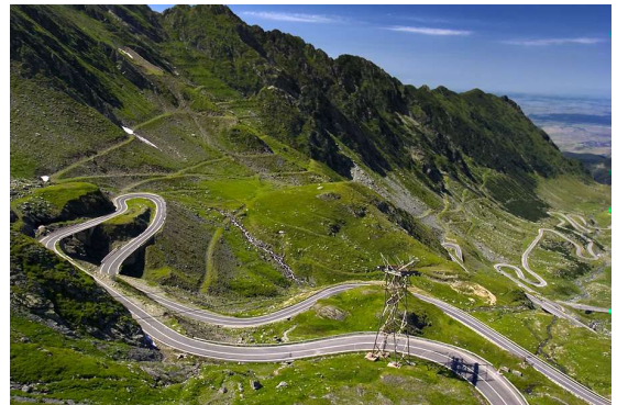
Carretera Transfagarasan – Càrpat-