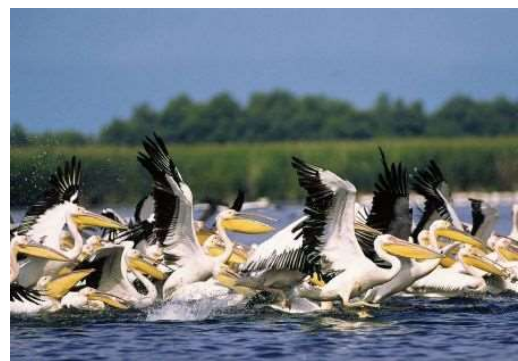
Delta del Danubi