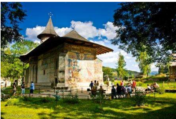
MOnestir de Voronet (Bucovina)