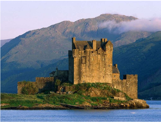
Castell de Eilean Donan