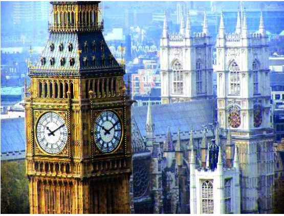
Londres: Big ben i l'abadia de Westminster