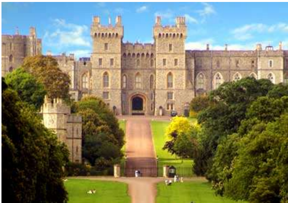
Castell de Windsor