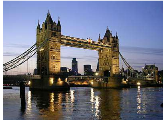
Londres: Pont de la torre