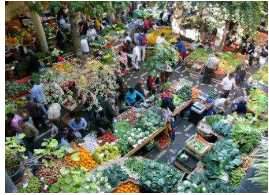
Mercado dos Lavradores (Funchal)