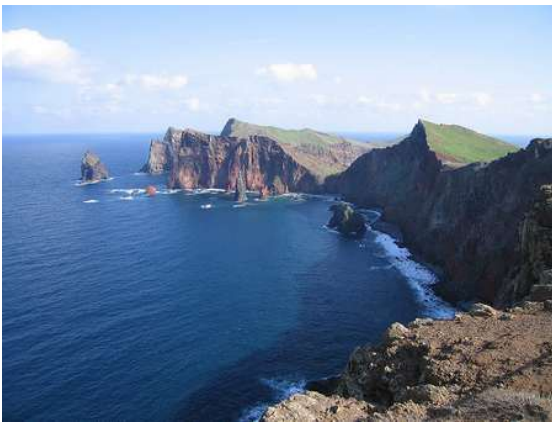
Cabo Sao Lorenzo