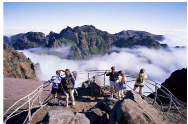
Pico do Arieiro