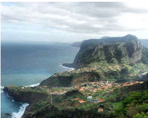
Penha de l'Aguila