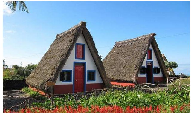
Cases tradicionals a Santana