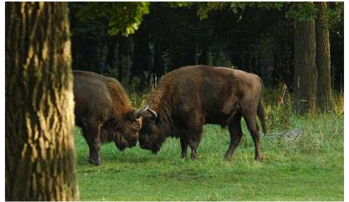
Bisonts al parc Natural de Bialowieza