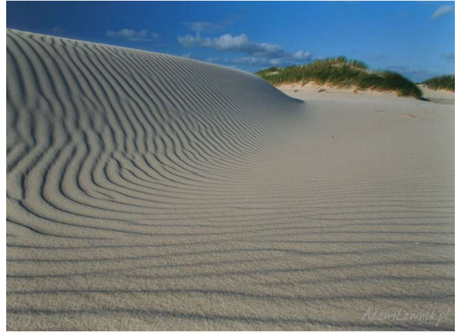
Parc Natural d'Slowinski