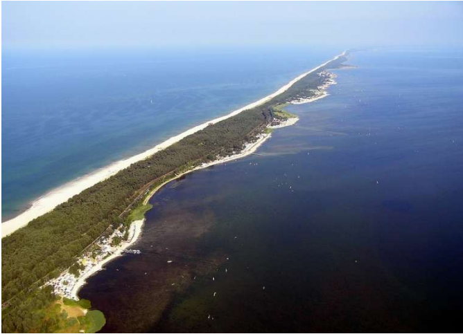
Península de Hel