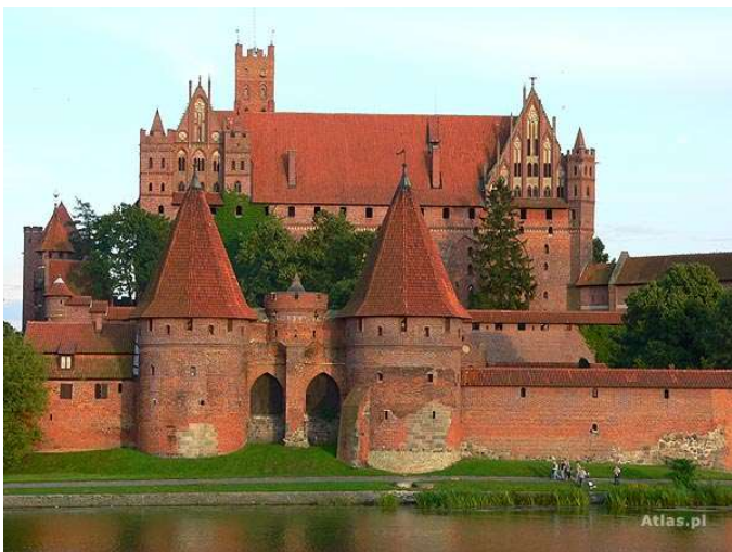
Castell de Malbork