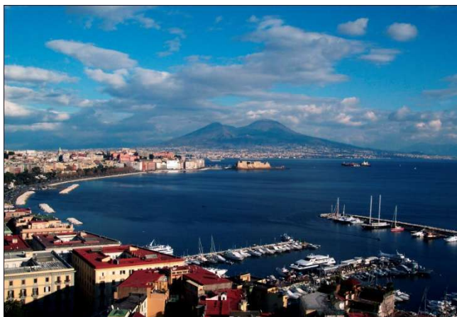
Nàpols amb el Vesubi al fons