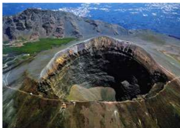
Cràter del Vesubi