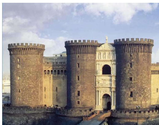
Castell Maschio Angionio, Nàpols