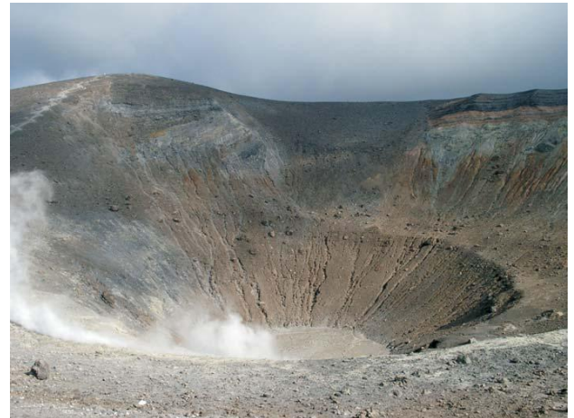
Cràter de Vulcano (accesible a peu)