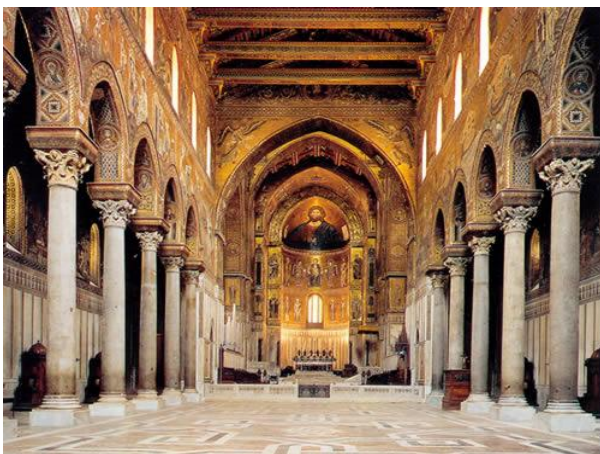
Catedral de Montreale