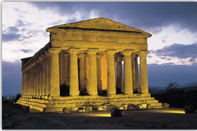
Temple de la concòrdia (Agrigento)