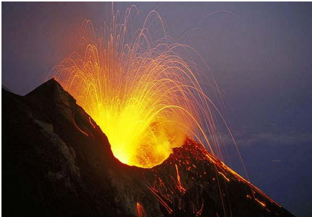
Stromboli (erupcions cada 20 minuts)