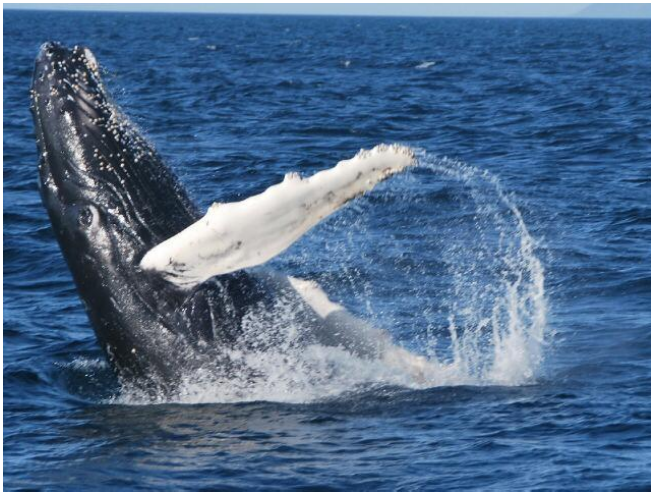
Avistaments de balenes