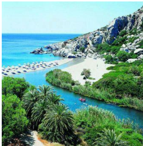
Fotogènica platja de Pleveli (Plakias)