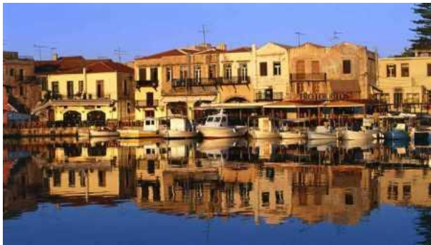
Port de Rethymnon