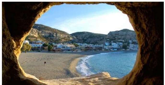
Platja de Matala des d'una de les seves coves