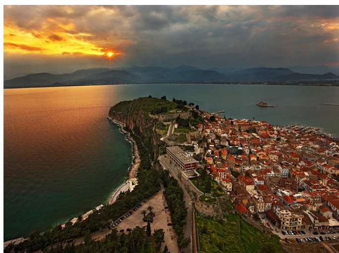
Poble de Nafplio