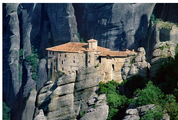
Monestirs de Meteora