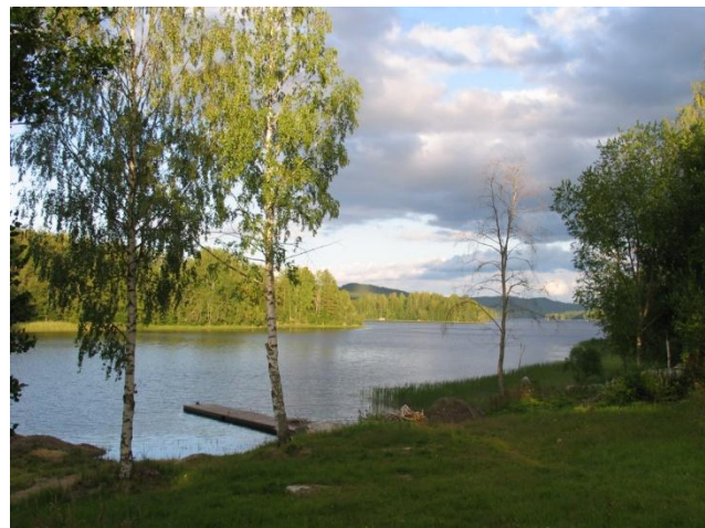
Llac a prop de Koli