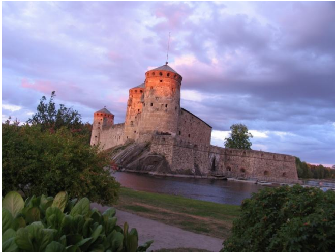
Castell de Savonlinna