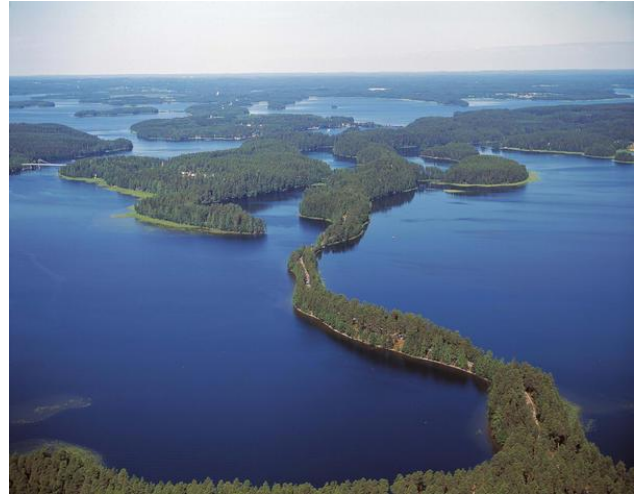
Llacs i boscos a Savonlinna