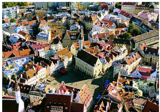
Plaça de l'ajuntament (Tallinn)