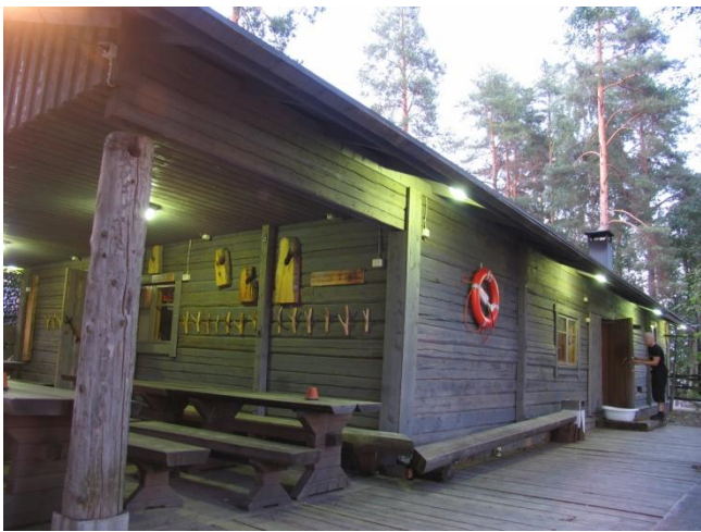
La Sauna més gran del mon (Kuopio)