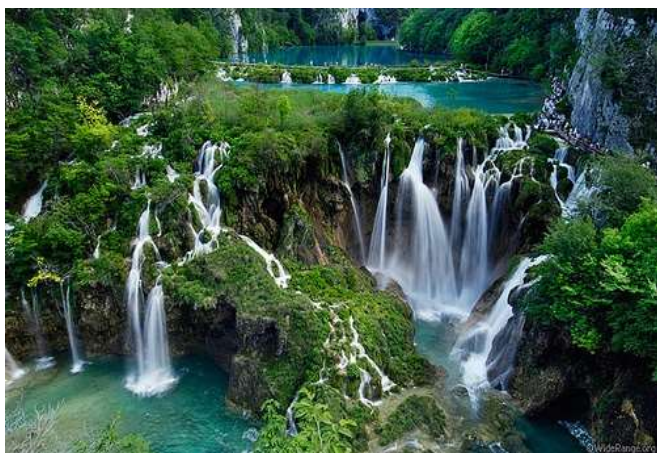
Llacs de Plitvice