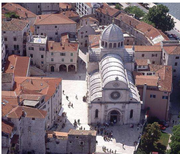
Catedral de Šibenik