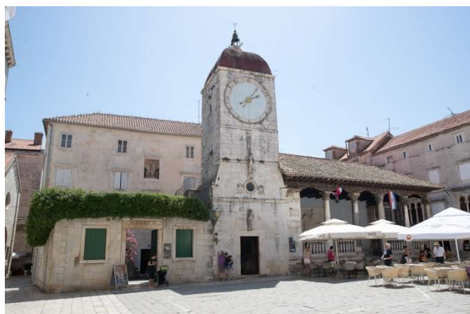
Trogir, torre del rellotge i ilotja