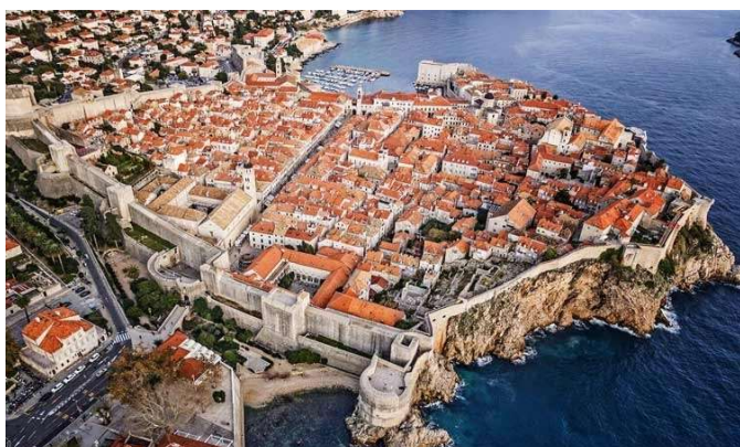
Dubrovnik, vista aèria