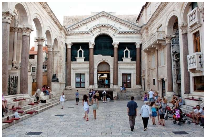
Peristil del Palau de Diocleciana, casc antic de Split