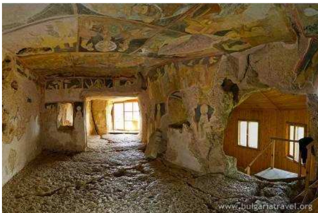
Esglésies rupestres a Ivanovo