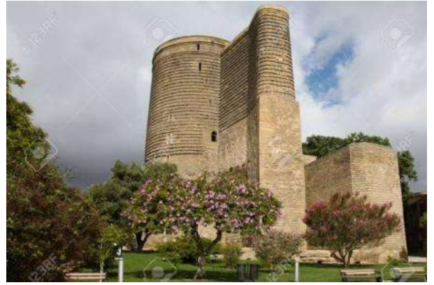
Torre de la Donzella, Bakú