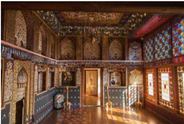
Interior del palau del Khan, Sheki