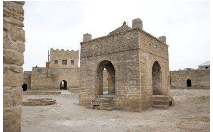
Temple del foc de Ateshgah