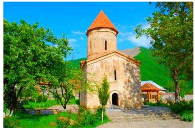
Església albanesa de Kish