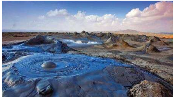
Gobustan National Park