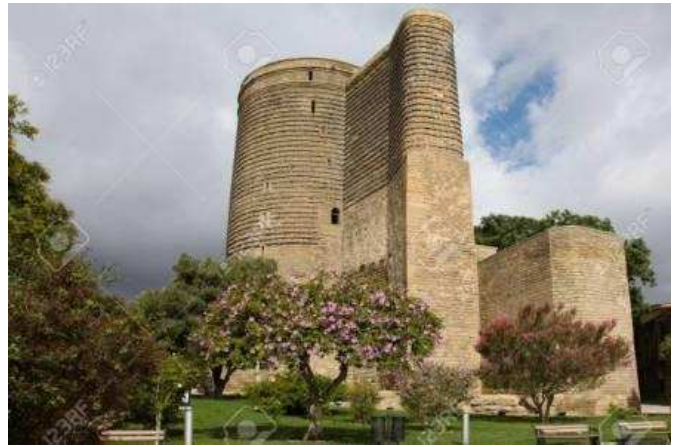
Torre de la Donzella, Bakú