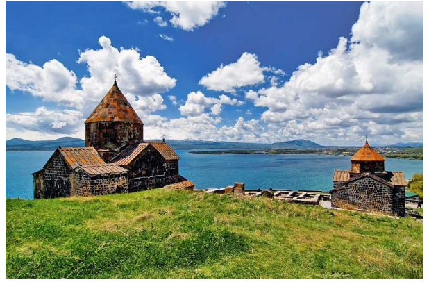
Sevanavank i llac Sevan