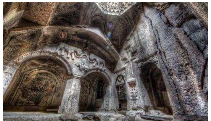
Interior del monastir de Geghard