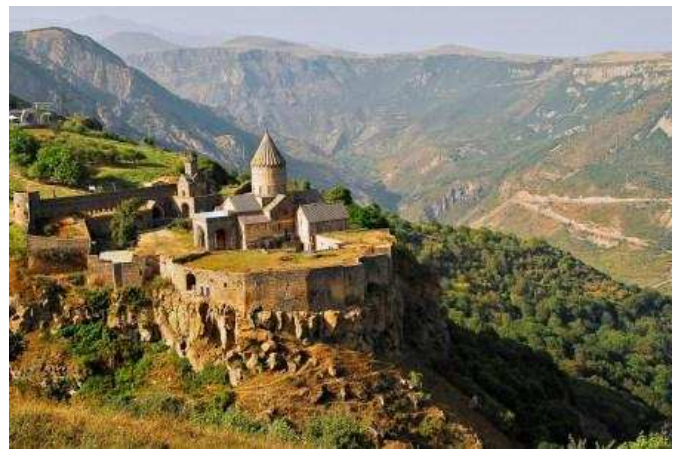
Monastir de Tatev