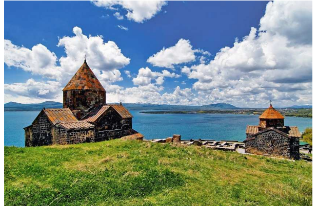
Sevanavank i llac Sevan