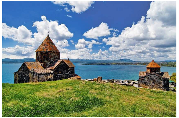
Sevanavank i llac Sevan