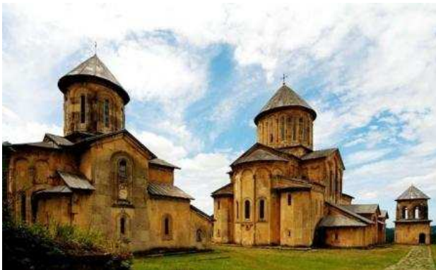
Monastir de Gelati