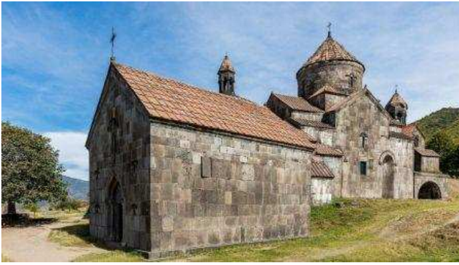
Monastir de Haghpat