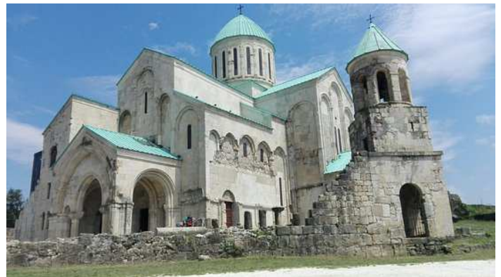
Catedral de Bagrati, Kutaisi