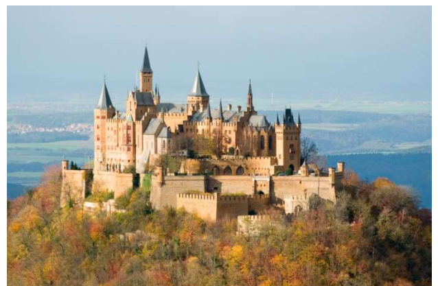
Castell de Hohenzollern