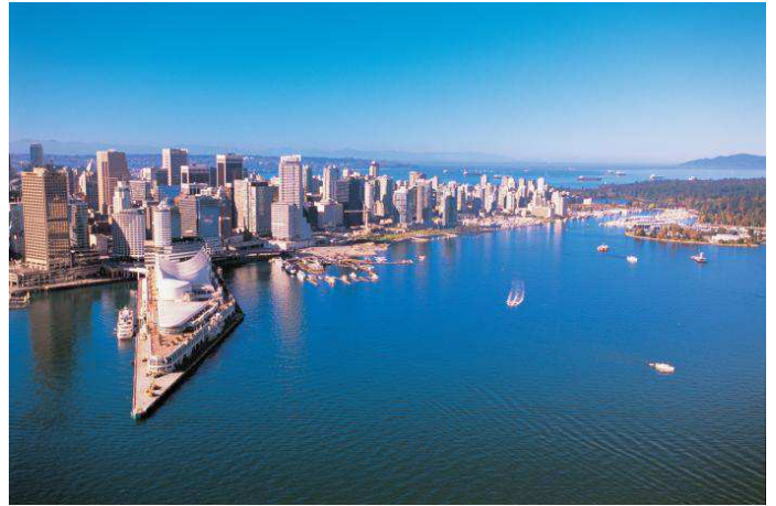
Vancouver (British Columbia)