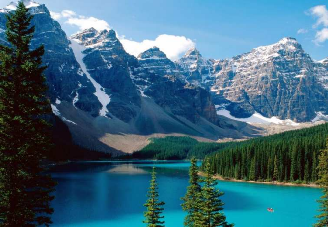
Lake Louise, Alberta