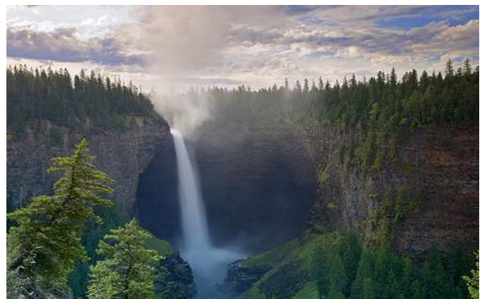
Wells Gray Provincial Park, British Columbia