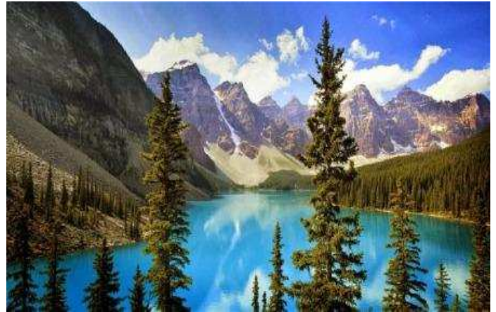
Banff N. P, Alberta