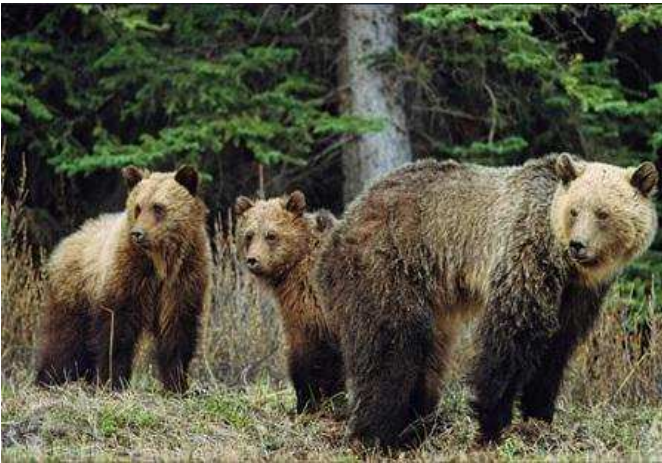
Ossos grizzlys, Jasper N. P; Alberta