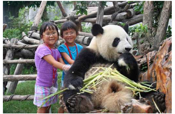
Santuari Panda (Chengdu)