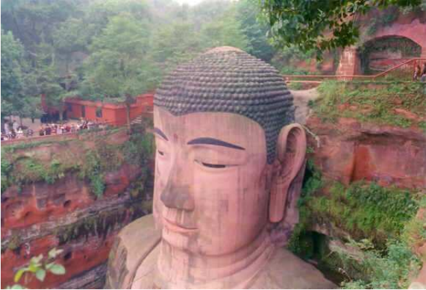
Gran buda de Leshan