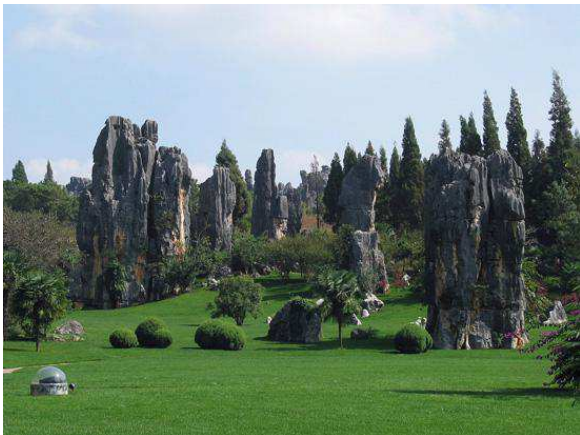
Bosc de pedra a Shilin