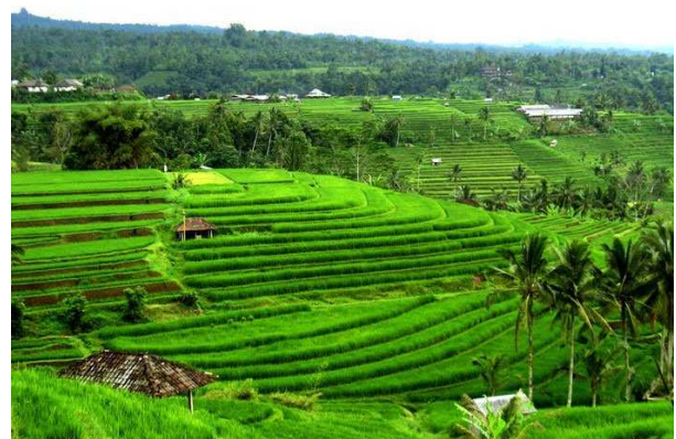
Arrossars a Jatilawit