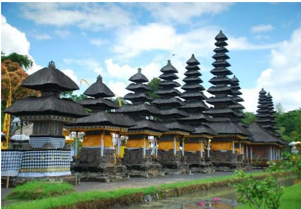
Taman Ayun, Patrimoni Mundial