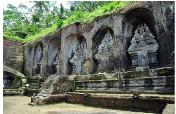
Gunung Kawi, Patrimoni Mundial