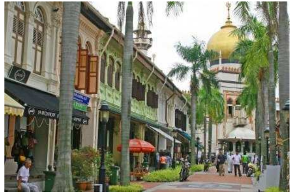
Kampong Glang: Arab Quarter, Singapore