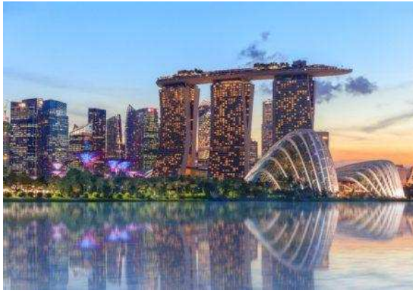
Singapore: Marina Bay Sands i Gardens by the Bay