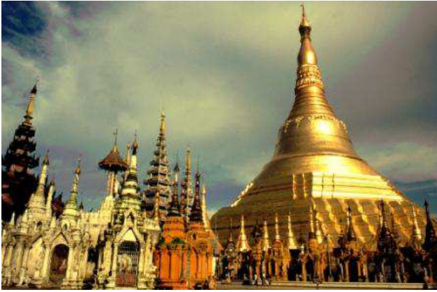
Shwedagon Pagoda, Yangon