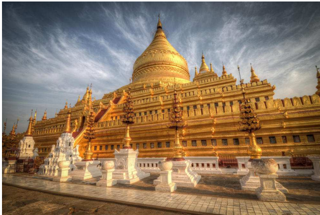
Shwezigon pagoda, Bagan