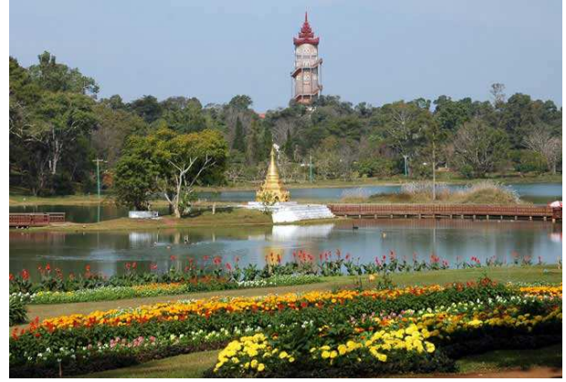
Jardi botànic de Pyin Oo Lwin