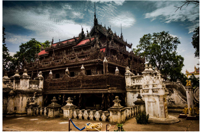
Shwenandaw monastery, Mandalay