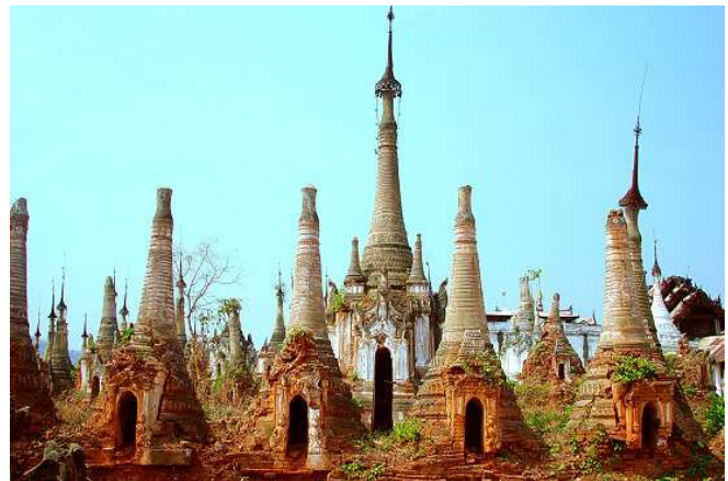
Pagodas a Indein