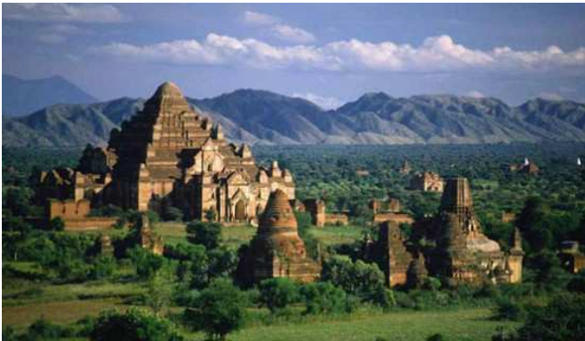
Dhamyangyi temple, Bagan