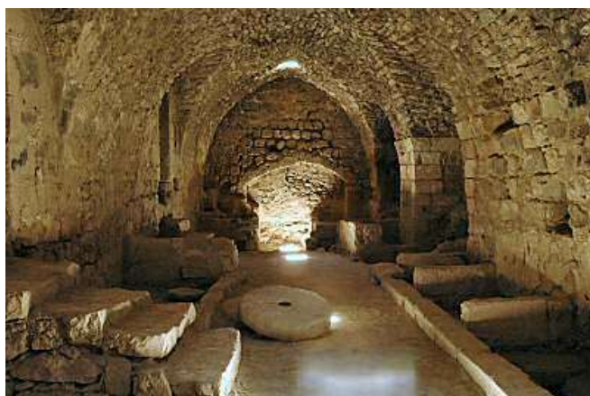
Interior de Kerak