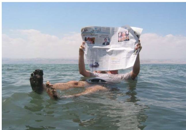
Bany al Mar Mort