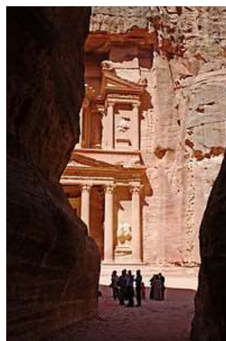
El Tresor, a Petra