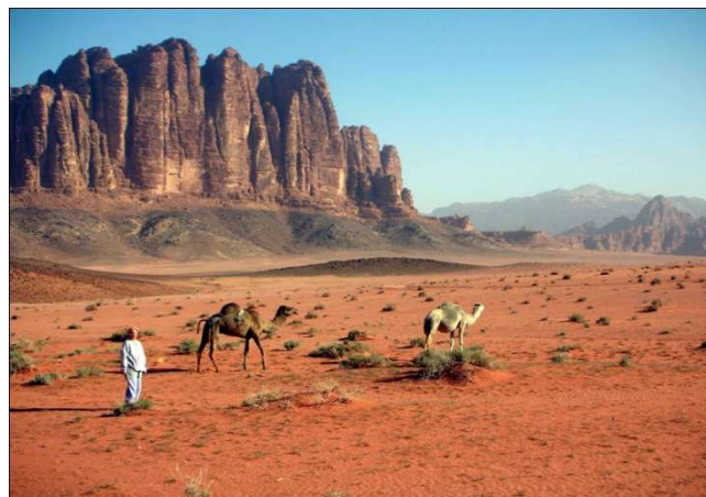
Desert del Wadi Rum