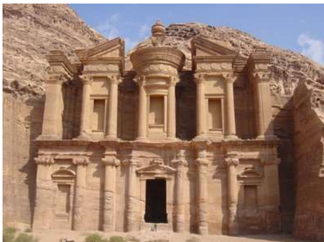
El Monestir, a Petra