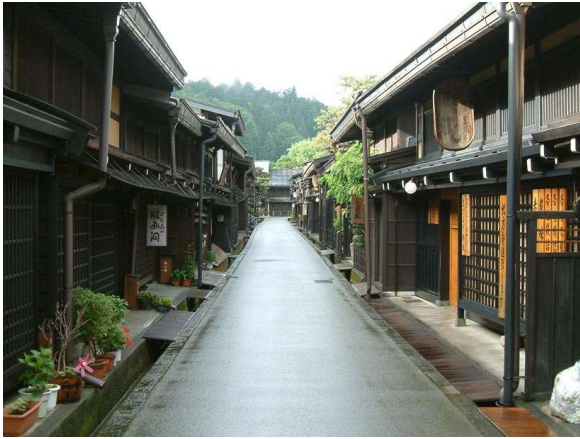
Poble medieval de Takayama