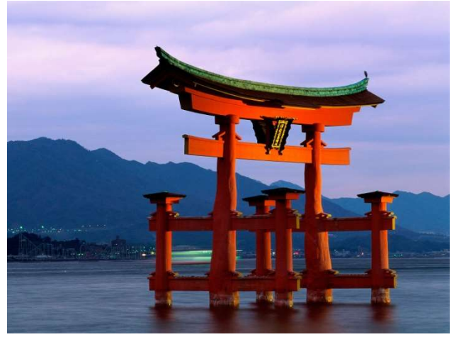
Illa de Miyajima