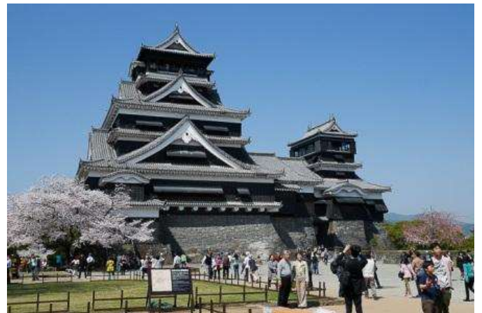
Castell de Kunamoto