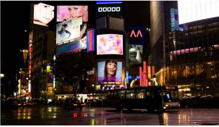
Tokyo de nit