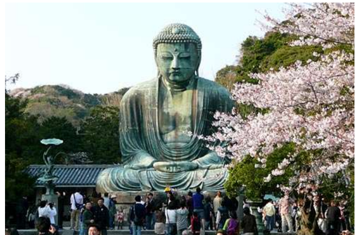
Buda de Kamakura