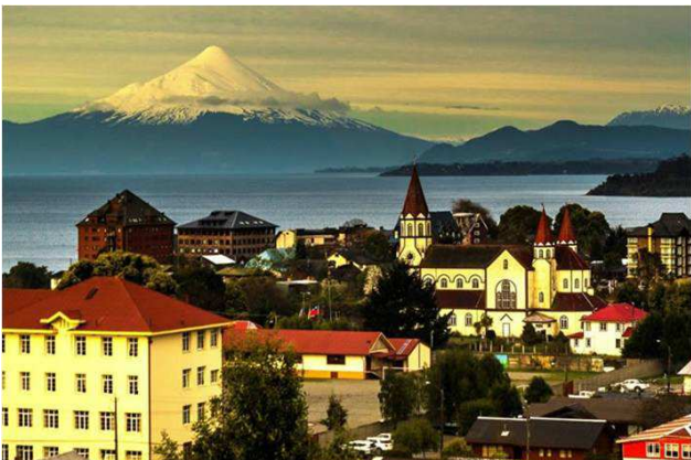
Puerto Varas, llac Llanquihu i volcà Osorno