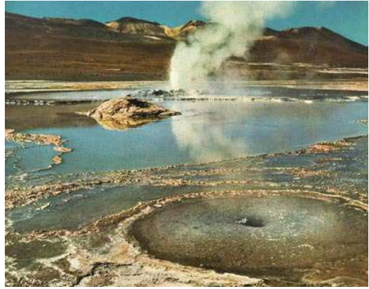
Gèisers del Tatío (Atacama)