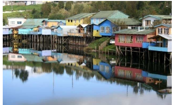
Palafits a Chiloe