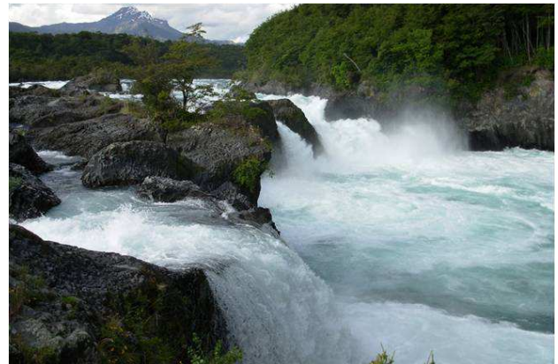
Saltos de Petrohué, regió dels Llacs