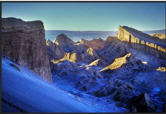
Valle de la Luna, Atacama