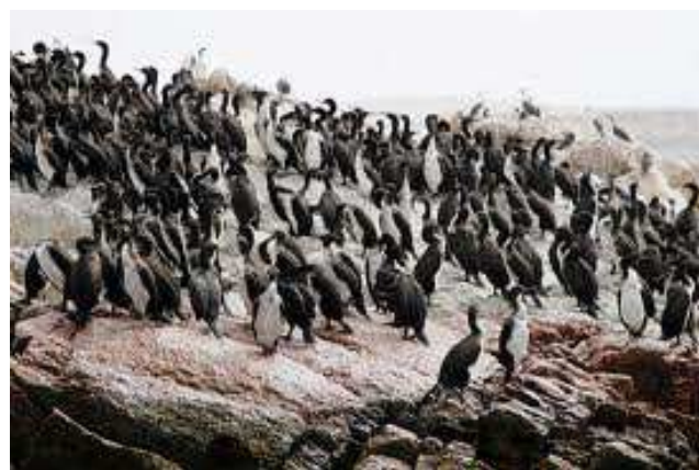
Pingüins a les Illes Ballestas