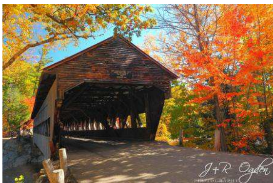
Pont de Fusta a Albany- White Mountains