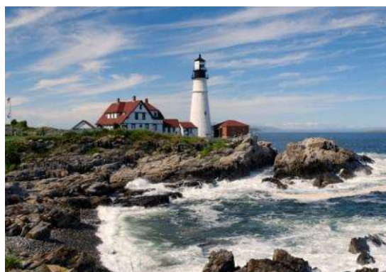
Far a la costa de Portand