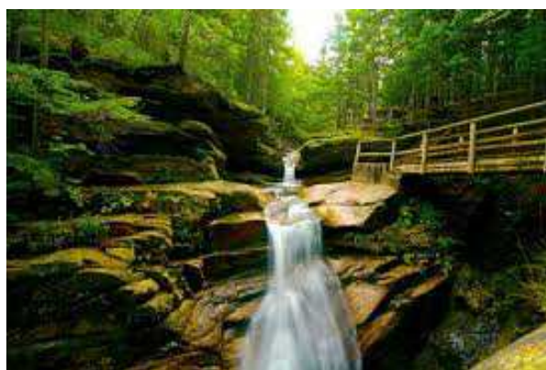
Sabbaday Falls- White Mountains