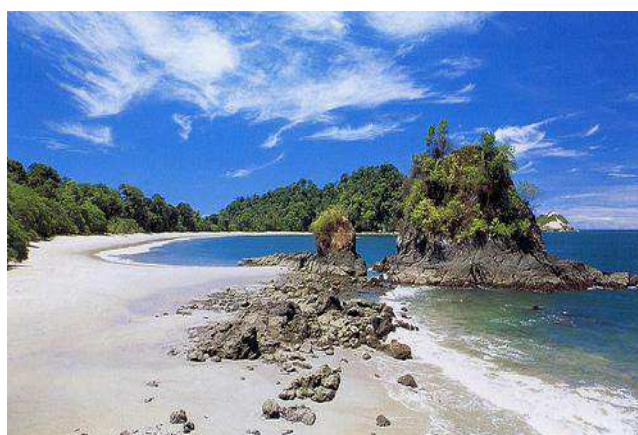
P.N Manuel Antonio