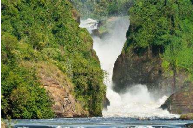
Murchison falls National park