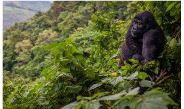
Bosc impenetrable de Bwindi