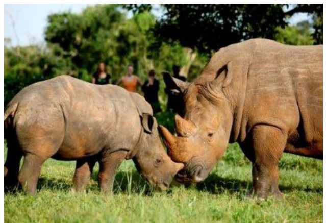
Ziwa Rhino Sanctuary