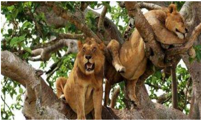
Lleons grimpadors a Queen Elisabeth NP