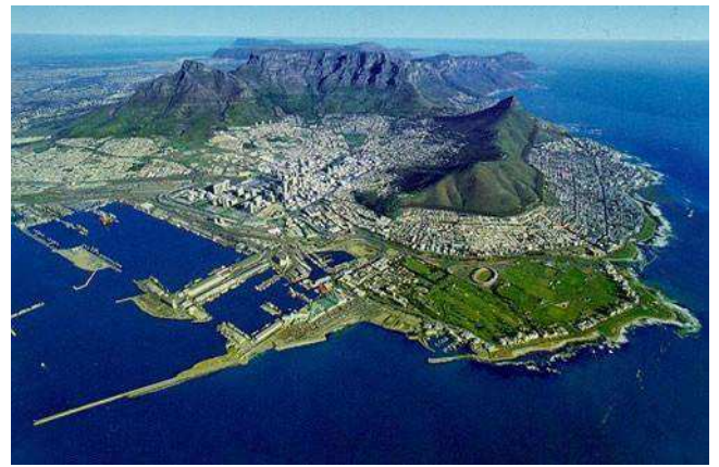
Ciutat del Cap amb el Table Mountain