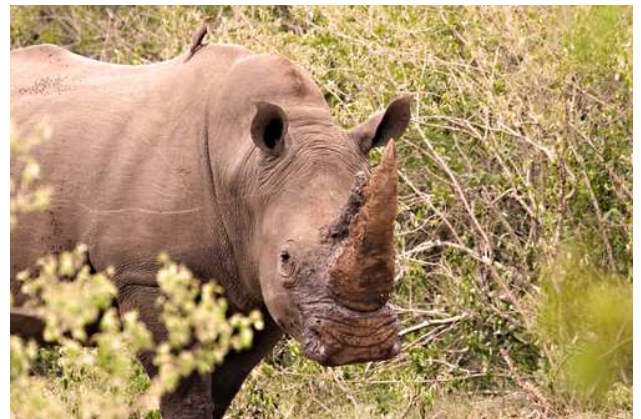
Rinoceront al Parc Kruger