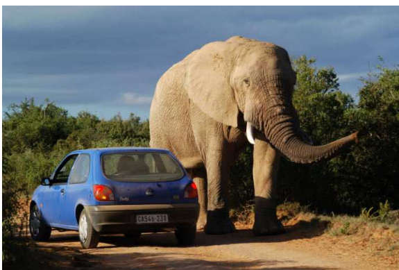
Addo National Park