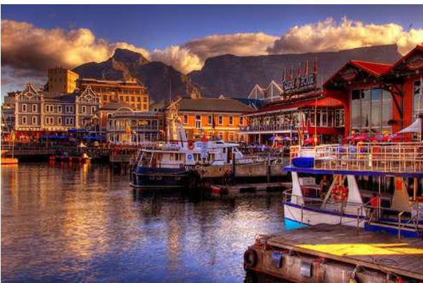
Waterfront, a Ciutat del Cap