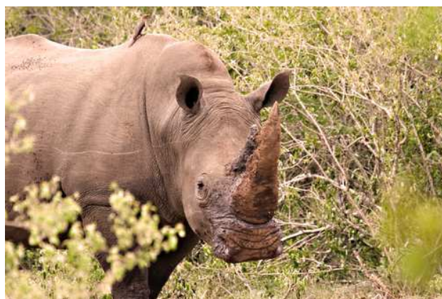
Rinoceront al Parc Kruger