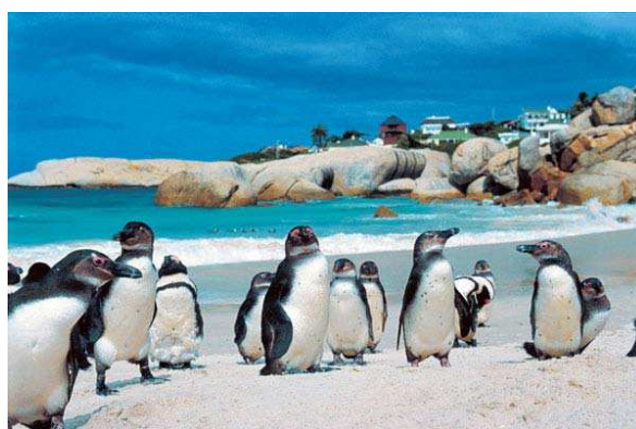
Colònia de pingüins a Boulders beach