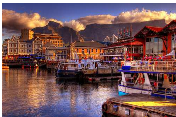
Waterfront, a Ciutat del Cap