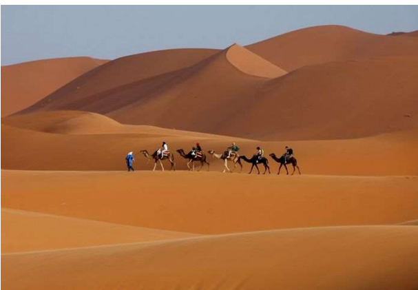
Dunes de Merzouga