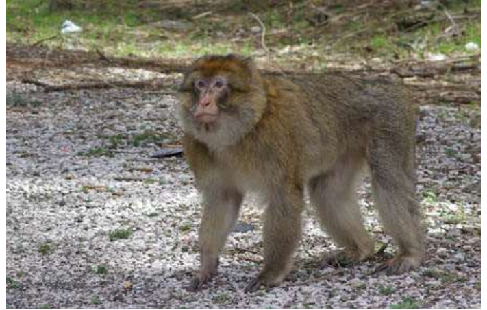
Micos a Azrou