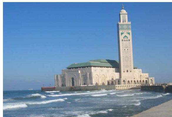
Mesquita de Hassan II, Casablanca