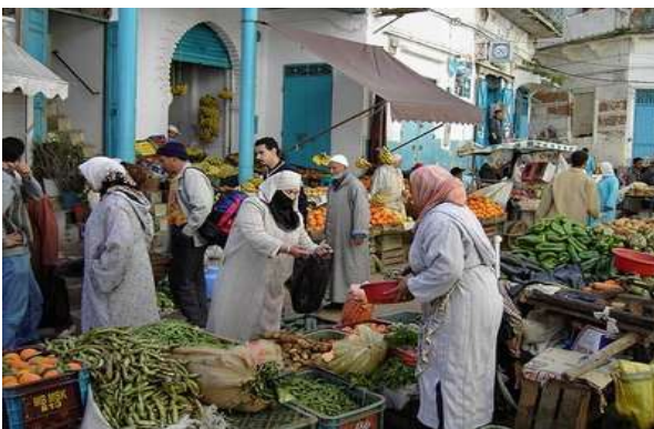
Souk a Larache