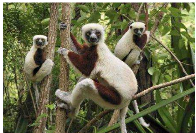
Andasiba-Montadia National Park