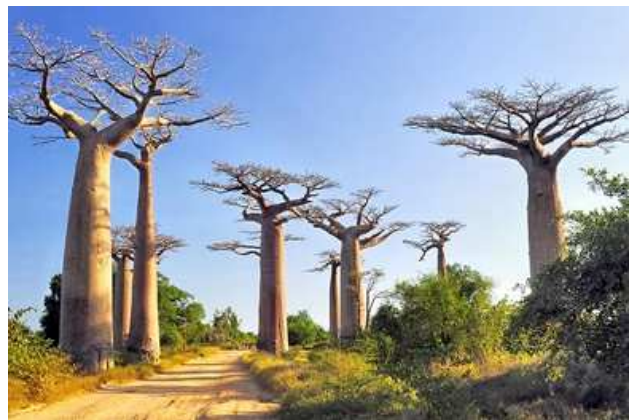
Baobabs avenue, Morondava