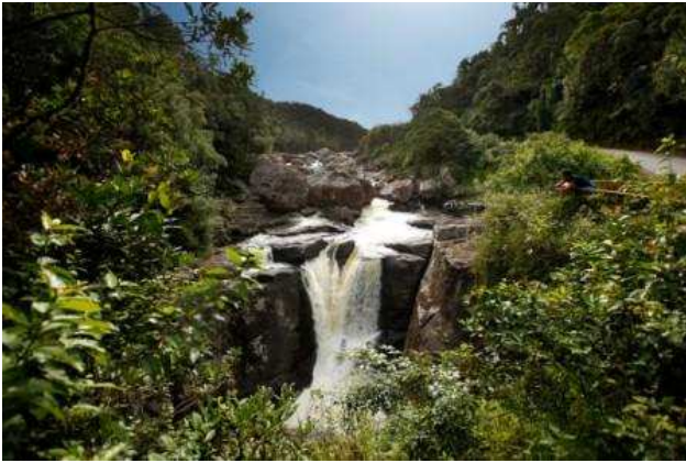
PN de Ranofamana